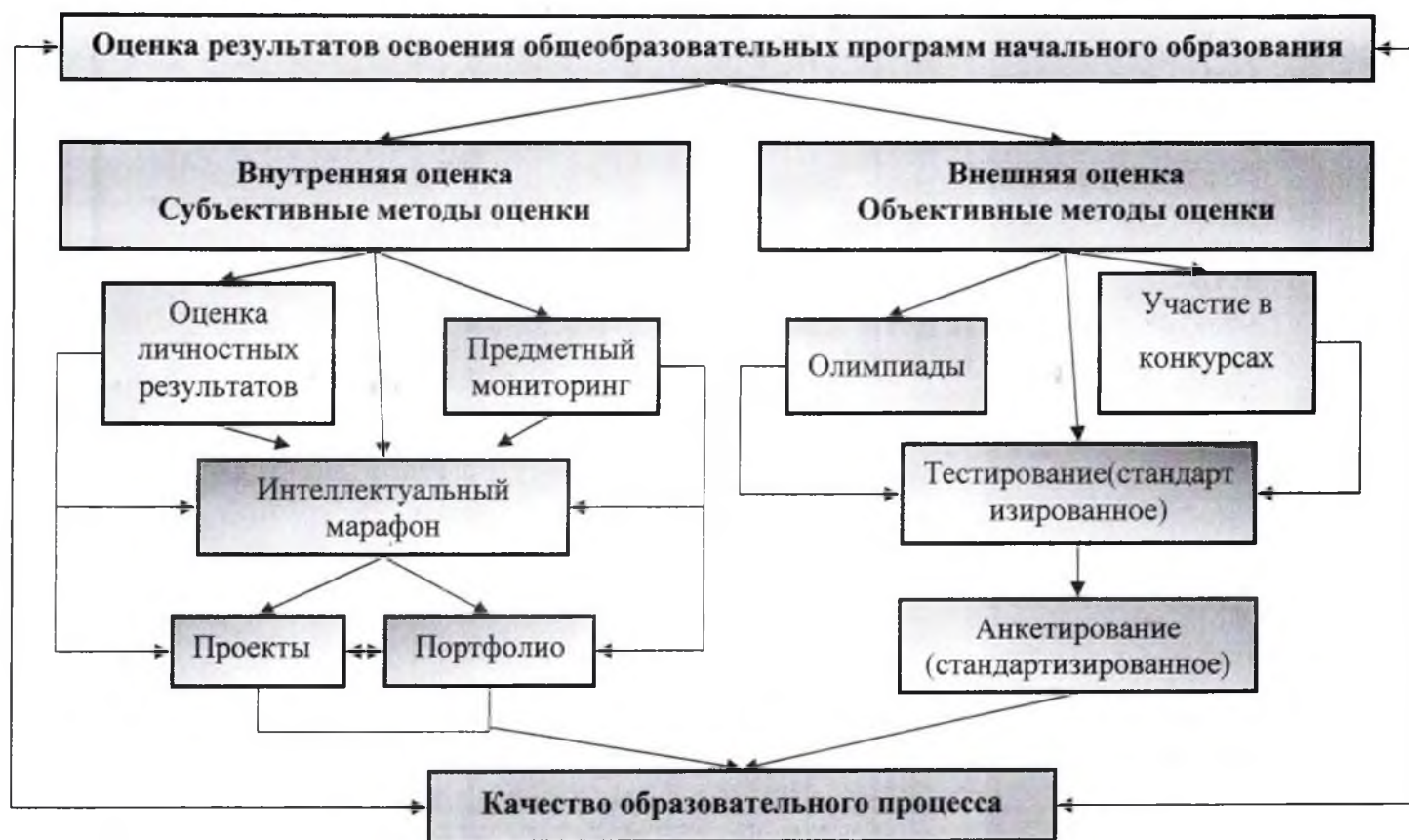
Система оценки достижения планируемых результатов основной образовательной программы начального общего образования МБОУ «Пычасская СОШ»

Портфель достижений учащихся как инструмент оценки динамики индивидуальных образовательных достижений.